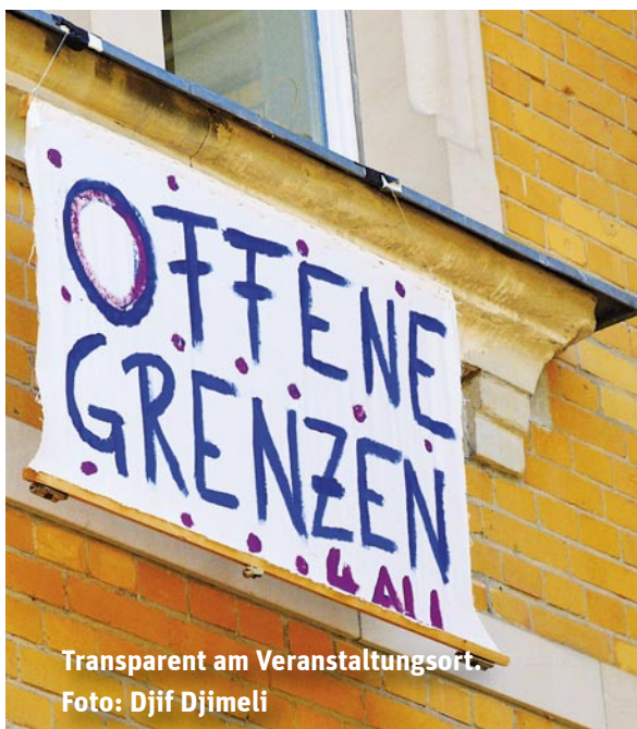
Transparent am Veranstaltungsort.