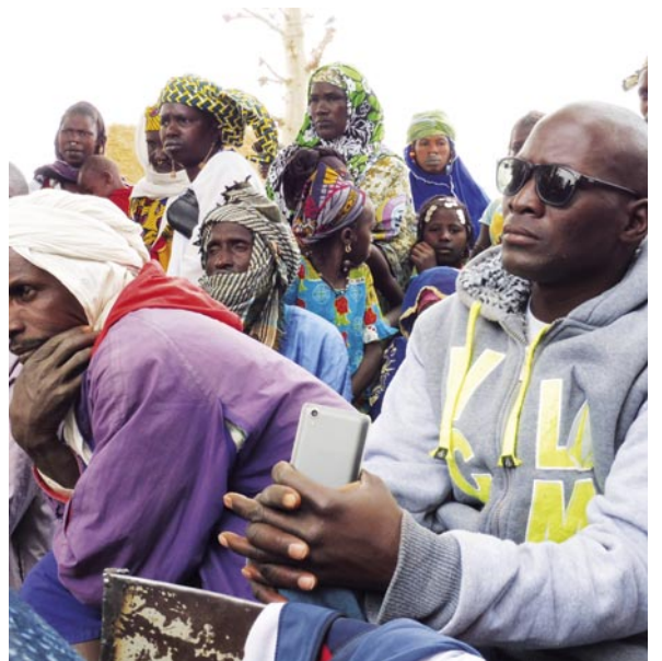
Bäuerliche Versammlungen in den Dörfern Tikerre Moussa und Kourouma (beide Mali), 2015/2016.