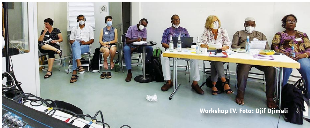
Workshop IV.

In der abschließenden Debatte herrschte im Grundsatz Einigkeit. Mehrere Teilnehmer:innen unterstrichen die Notwendigkeit, sich für die Freiheit der Presse einzusetzen. Zudem müsse die Bevölkerung umfassend informiert werden, auch in lokalen Sprachen. Und europäische Länder müssten sicherstellen, dass potentiell gefährdete Oppositionelle bei Gefahr in Verzug jederzeit ihr Land verlassen könnten, ohne aufreibende Visaverfahren. ●