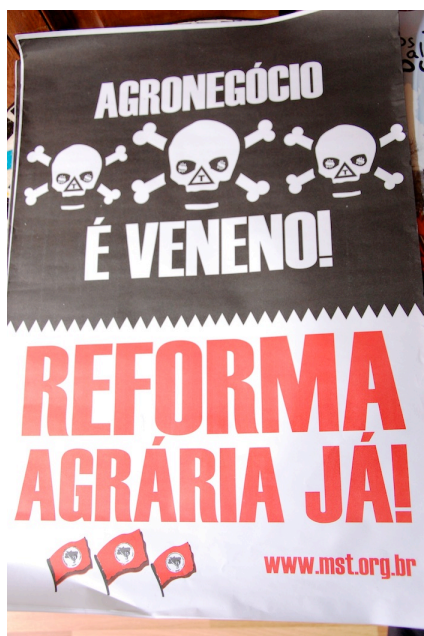
Affiche de la campagne pour la réforme agraire au Brésil.

Les paysans sans terre n'en sont pas moins actifs pour réclamer leurs droits. Malgré la criminalisation dont ils font l'objet, de nombreux mouvements de paysannes et paysans réclament des terres à cultiver, occupent des terres pour produire des aliments pour leurs familles et leurs communautés et exigent de leurs autorités des législations foncières justes. On retrouve de tels mouvements de résistance dans de très nombreux pays du monde tels que le Brésil, le Paraguay, la Bolivie, le Honduras, le Nicaragua, l'Indonésie, la Thaïlande, l'Inde ainsi que dans la plupart des pays africains comme nous le constatons lors de cette conférence.