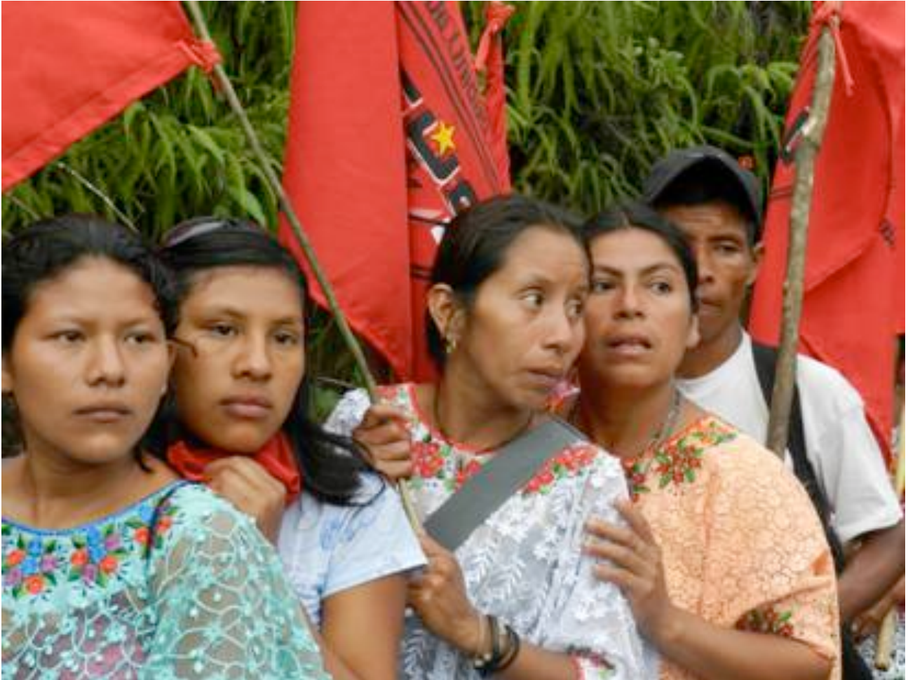
Marche vers la capitale du Guatemala des paysans et paysannes expulsés de leur terre pour revendiquer leur droit à la terre. Mars 2012.

Le grand capital criminalise les mouvements sociaux. Au Honduras, 50 paysans ont été assassinés en une année (2010-2011). Au Guatemala, les paysans sont expulsés et perdent leurs terres et leurs habitations; trois personnes ont été assassinées et beaucoup emprisonnées.